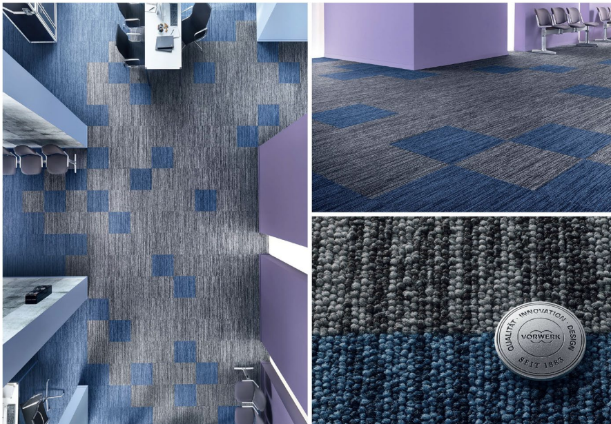
Moderne Modularität: Die neue Qualität SUPERIOR 1052 SL SONIC in den Farben 3Q10 und 9F87.

Mit einer Auswahl an unterschiedlichen Farben, Formen und Fliesenarten lassen sich also ganz individuelle textile Bodenmosaiken kreieren, die sowohl optisch, haptisch als auch akustisch ein Mehr an Einzigartigkeit bieten.