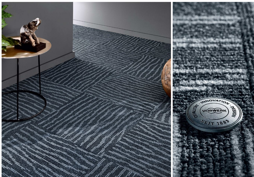
International besonders gefragt: SUPERIOR 1028 SL SONIC Design 1037, Farbe 5W83.

Vorwerk flooring stellt sich den veränderten Ansprüchen des nationalen und internationalen Marktes für textile Bodenbeläge im Objektbereich und besonders der wachsenden Nachfrage nach modularen Verlegeformen. In der Konsequenz hat das Unternehmen sein Sortiment der SONIC Fliesen weiterentwickelt und kombiniert ab Anfang 2019 mit seinem neuen Fliesen Sortiment höchste Strapazierfähigkeit mit besten Akustikwerten – und das als Standard.